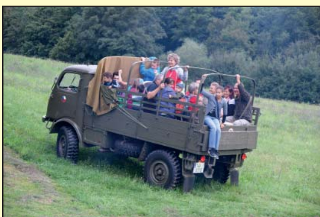
Plná korba zájemců o adrenalinovou projížďku terénním autem po Olšovci