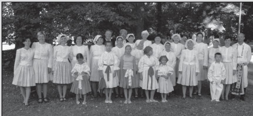
Nedachlebjan a Nedachlebjánek na Slavnostech vína