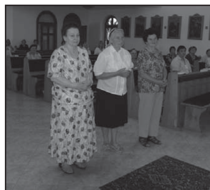
Jubilanti - 75 let o poutní mši svaté