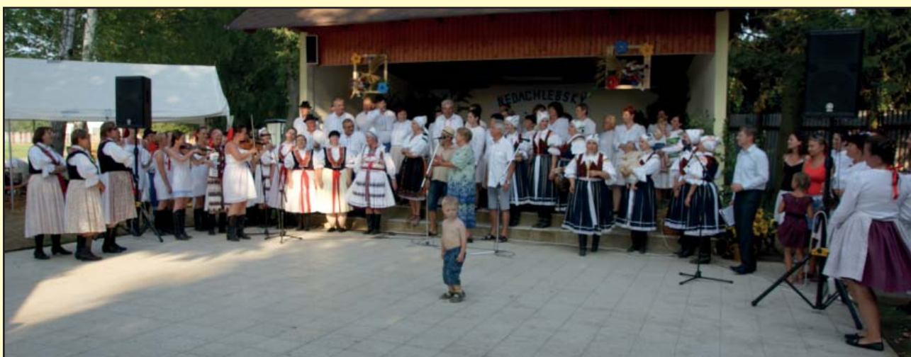
Všechny sbory na 1.ročníku soutěže o Nedachlebský džbánek