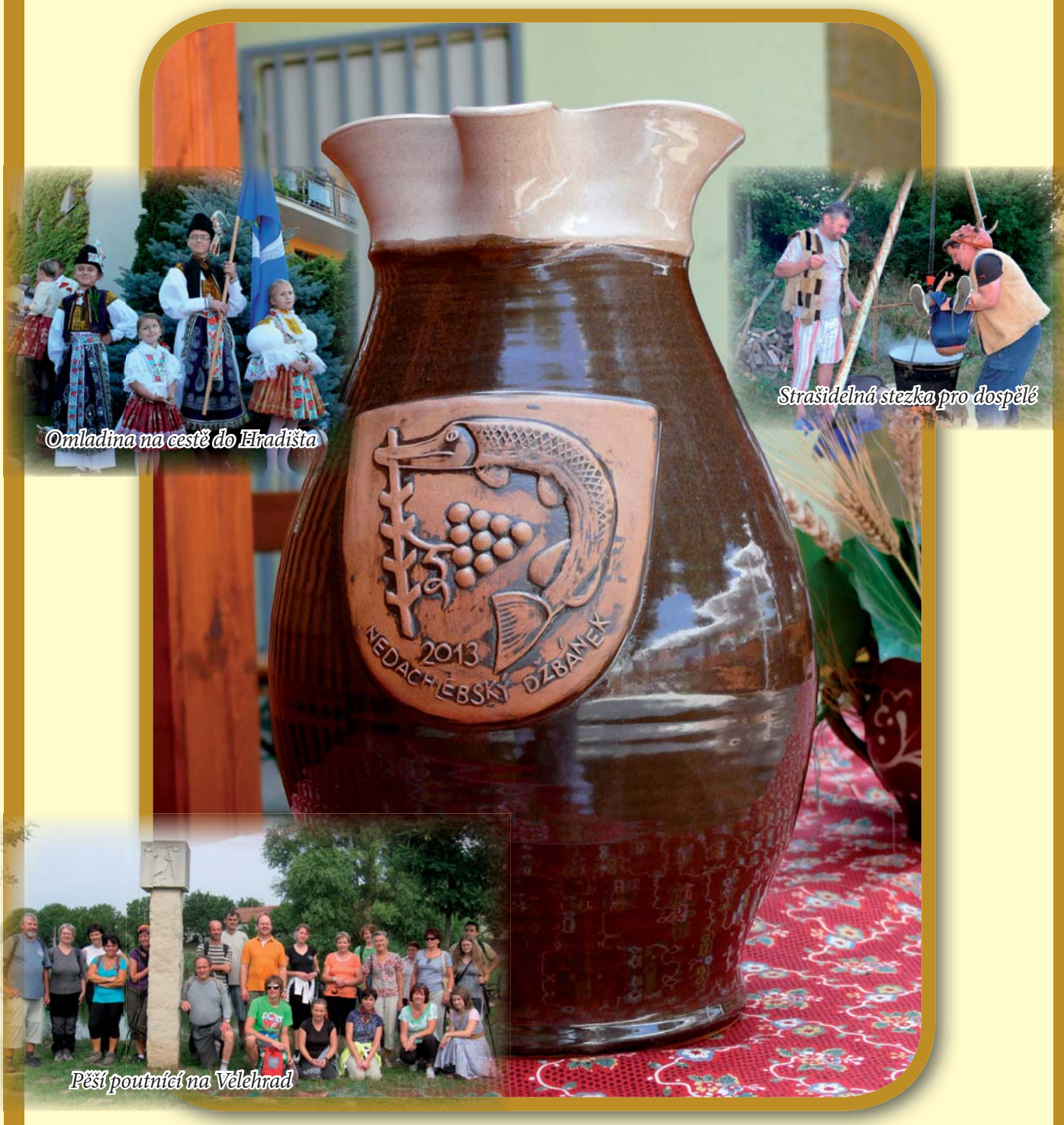
Omladina na cestě do Hradišta