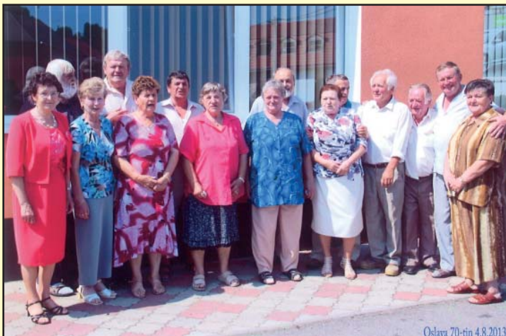
Ročník 1943 (sedmdesátníci) slavili v Bílovicích