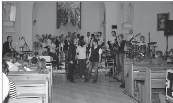
Vystoupení skupiny Paprsky