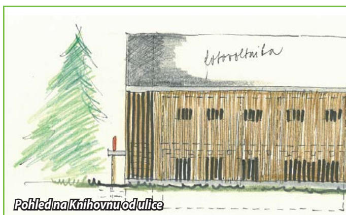
Pohled na Knihovnu od ulice