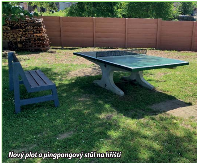
Nový plot a pingpongový stůl na hřišti