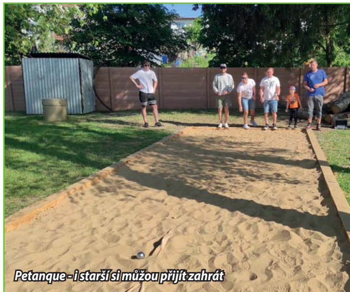
Petanque - i starší si můžou přijít zahrát