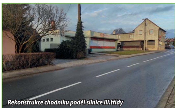
Rekonstrukce chodníku podél silnice III. třídy