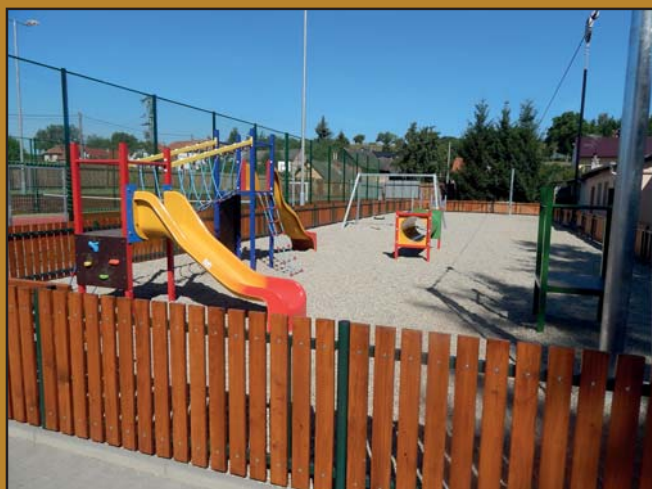
Dětské hřiště s průlezkami