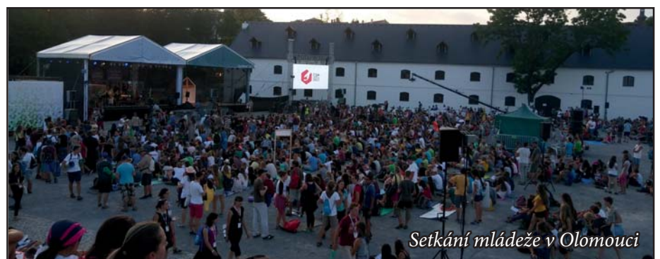
Setkání mládeže v Olomouci

Jestli vás zajímá, co jsme vlastně celý týden v Olomouci dělali, tak to rozhodně nemůžu shrnout do jedno-