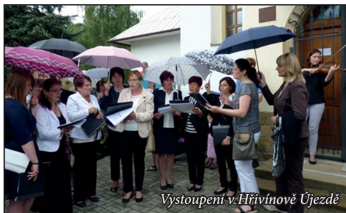
Vystoupení v Hřivínově Újezdě