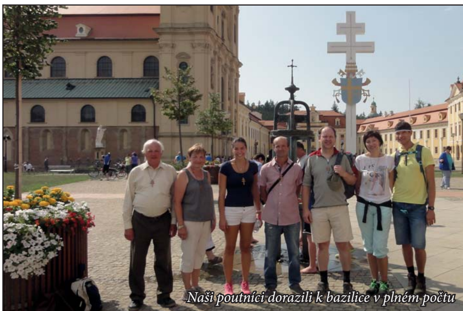
Naši poutníci dorazili k bazilice v plném počtu

tuto pouť na rok jsme se rozcházeli k domovu. Manželé Travencovi