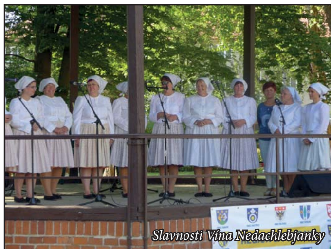
Slavnosti Vína Nedachlebjanky

8. a 9. září Uherské Hradiště rozkvetlo barvami krojů a opravdu bylo na co se dívat. Začal 15. ročník Slováckých slavností vína a otevřených památek. Letošní ročník zahájil v pátek na náměstí Míru náš Mikroregion „Za Moravů“. Sobota ráno začala jako tradičně průvodem krojovaných z Vinohradské ulice až na zmíněné náměstí. Smetanovy sady pak byly centrem našeho Mikroregionu, kde jsme vystoupily se svým připraveným programem písní z Luhačovského Zálesí a jiných. Bylo to krásné odpoledne.