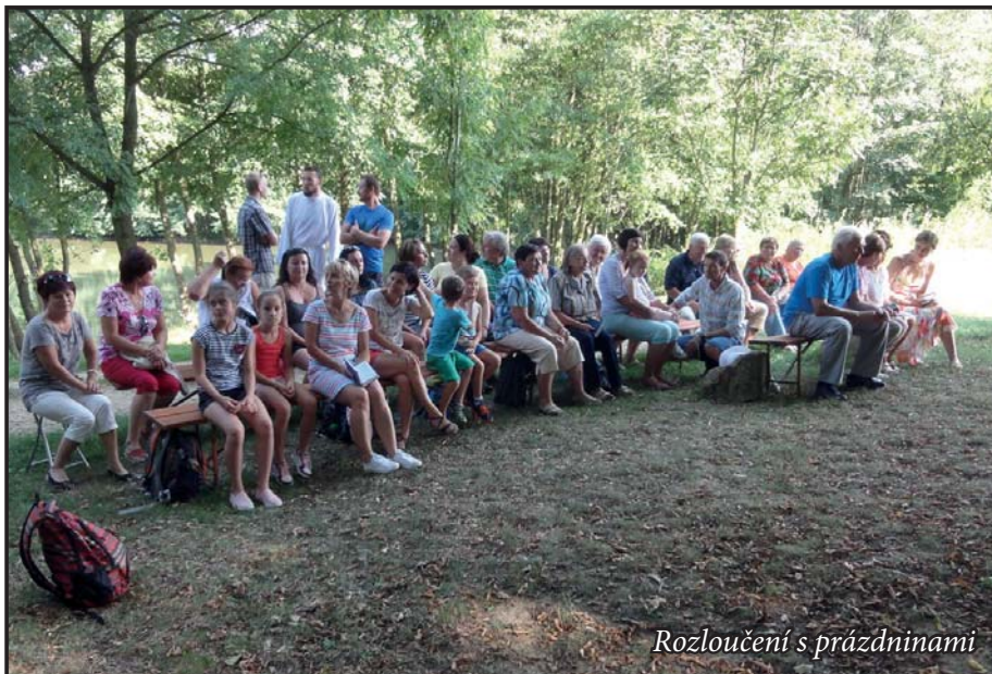
Rozloučení s prázdninami