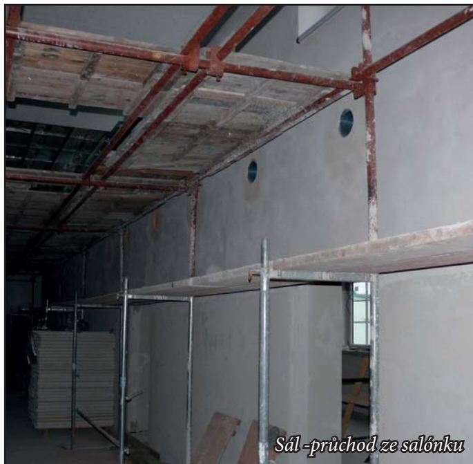
Sál - průchod ze salónku