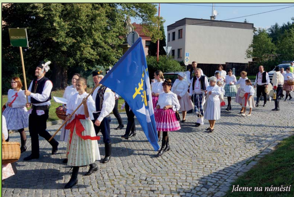
Jdeme na náměstí