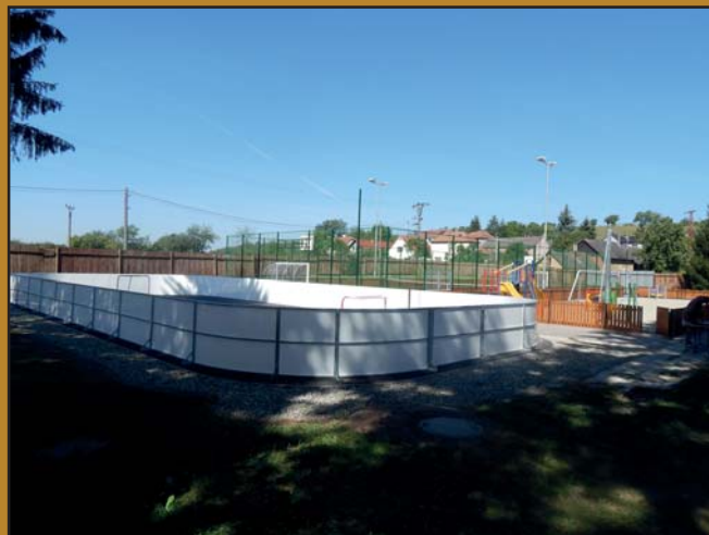
Celkový pohled na kluziště