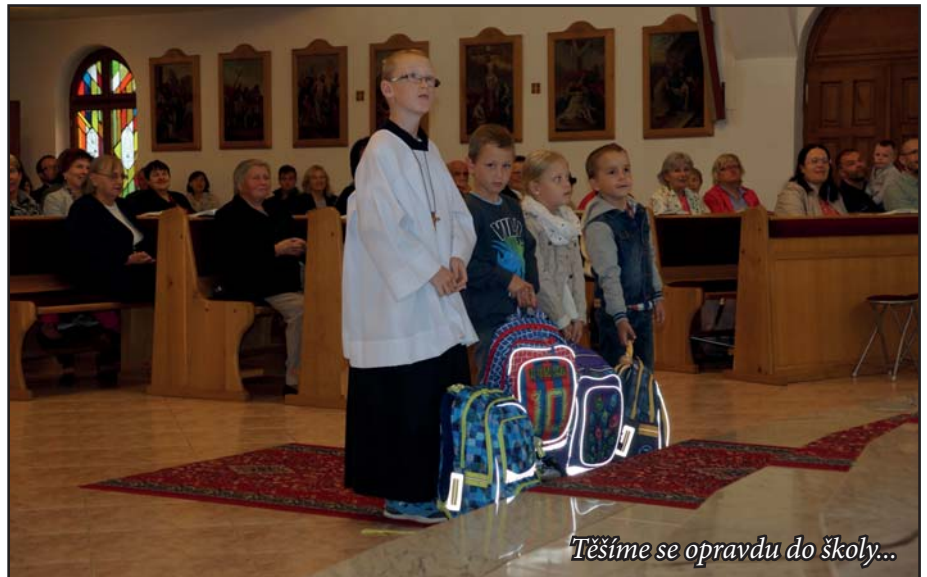
Těšíme se opravdu do školy...