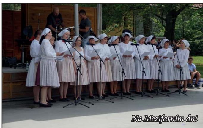
Na Mezifarním dni

Je už tradicí, že poslední červnovou neděli se park v Bílovicích stává centrem setkání lidí z naší farnosti, ale také různých hostů. Je nám potěšením, že jsme i my mohly zpestřit nedělní odpoledne a zazpívat všem posluchačům pár písniček. Byly to písničky hlavně z našeho blízkého okolí a tím je Luhačovské zálesí.