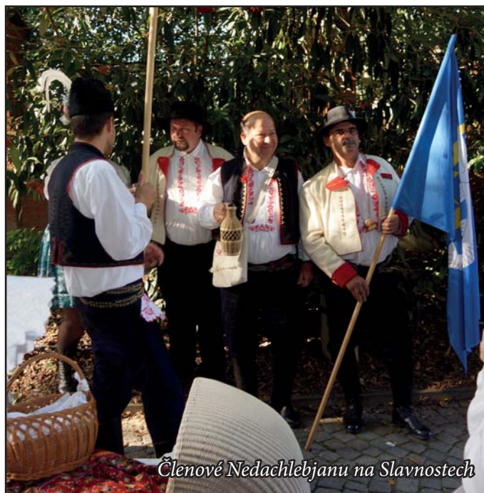
Členové Nedachlebjanu na Slavnostech