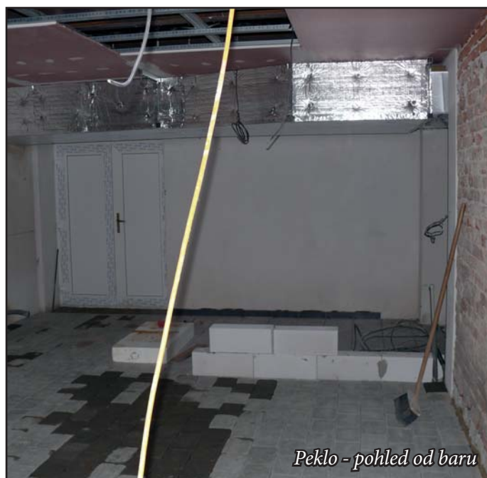
Peklo - pohled od baru