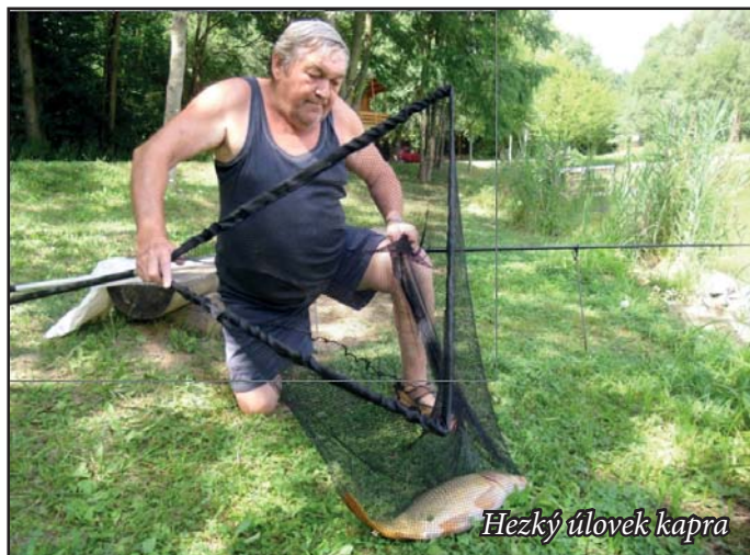
Hezký úlovek kapra