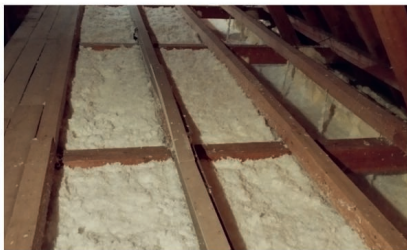
Foukaná izolace střechy kostela