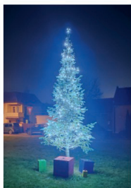
Vánoční strom na obci