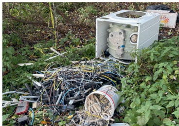
Skládka u Olšovce