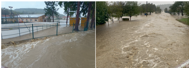
Povodeň září 2024

15. 9. 2024 - Pro některé normální neděle, pro jiné den, na který jen tak nezapomeneme. Nechtělo se mi uvěřit probuzení do nedělního rána, když jsme ještě v sobotu před půlnocí kontrolovali stav vody v potoce. V tu chvíli hladina vody oproti osmé večerní hodině téměř o metr klesla. O to větším šokem pak bylo nedělní ráno, kdy nám během 20 minut nestačily ani boty po kolena a během chvíle jsme se brodili ledovou vodou a snažili se zachránit co nejvíc věcí. Paniku, strach a stres vystřídal pocit bezmoci. Kdy a kde se voda zastaví. Tohle byly pocity, které se ovlivnit nedaly (některé ani v následujících dnech či týdnech). Čeho jsem si však na tomhle dni cenila a cením dodnes nejvíc, to byla ochota spoluobčanů. Od ranních hodin nefungovala elektrina, ale i tak se spousta občanů a sousedů podílela na tom, aby sehnali centrály s čerpadly nebo aby bylo obcí zajištěno teplé občerstvení a pití. Nedocenitelným nápadem byl fekální vůz, který výrazně urychlil odčerpání zatopených prostor. Následující den bylo zajištěno několik kontejnerů na věci, se kterými jsme se museli rozloučit, rovněž byly obcí zajištěny vysoušeče zdí. Nebyla to ničím povinností strávit nejen nedělní den pomocí, snahou a ochotou snížit škody a následky, které se v Nedachlebicích na Holýškách v tento den udály. Obrovské díky proto patří panu starostovi i všem pracovníkům obce, a rovněž všem spoluobčanům a sousedům, kteří se dobrovolně angažovali.