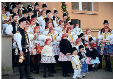
Martinské hody 2024