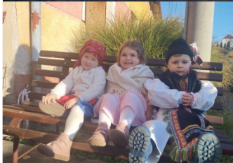
Děti v kroji