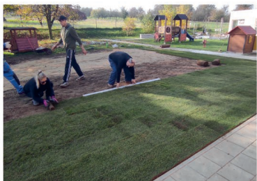
Pokládka nové trávy ve školce