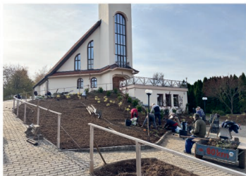
Úpravy před kostelem