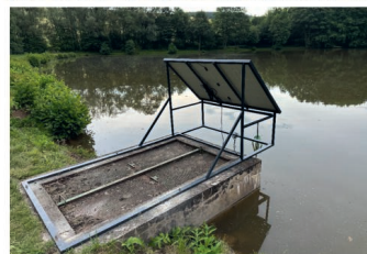
Solární prouzdusňovač - i přes parné léto, ryby vydržely