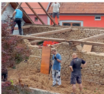
Bourání staré stodoly realizovali farníci ve spolupráci s obcí