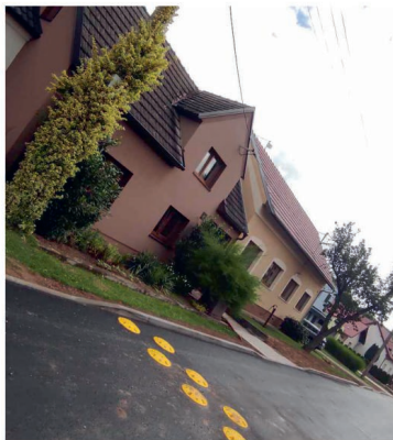
Milované a nenáviděné zpomalovací pecky na nové komunikaci

Když se tedy vrátím na úplný začátek mého úvodu, z různých zdrojů se na území obce v letošním roce prostavělo nebo prostaví přibližně 28 miliónů korun.