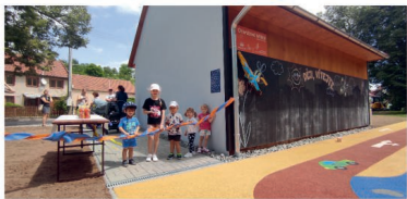
Otevření dětského hřiště na Hliníkách

Už více než dva roky se snažíme uspokojit