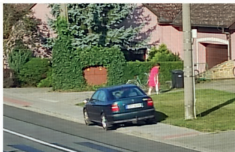
Náhodně vybrané dvě fotografie z archivu asi 50 aut...