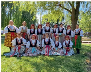
Mezifarní den v Bílovicích

V červnu jsme Vás zvali na Mezifarní den v Bílovicích, kam jsme byly opět po roce pozvány. Jelikož vyšlo krásné počasí, akce se velice povedla. Po Mezifarním dni jsme si daly menší pauzu, ale jelikož jsme byly pozvány 20. července do Ostrožské Nové Vsi na Letní zpívání, nebyla zase tak dlouhá. Letní zpívání proběhlo v restauraci U Racka na zahrádce. Na akci vystoupilo spoustu sborů s krásnými písněmi. Například ženský sbor Čečera nebo mužský sbor Ratiškovice. Celý program zahájil místní ženský sbor Denica písněmi a uzavřel komediální scénkou, u které se nejeden divák zasmál. Po hlavním programu následovala beseda u cimbálu. Celé odpoledne jsme si náramně užily a děkujeme ŽS Denica za pozvání.