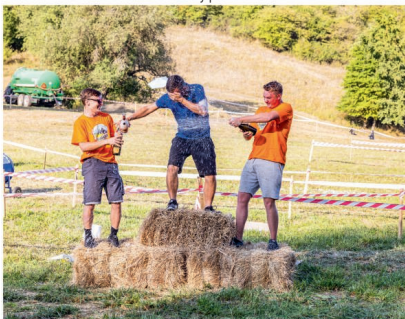
Vítězové 5. ročníku traktoriády