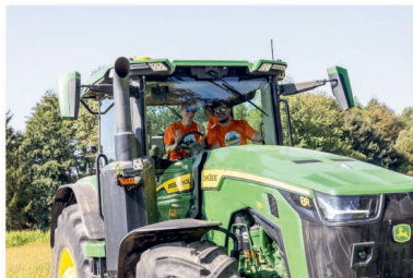
Jeden z největších traktorů letošní traktoriády