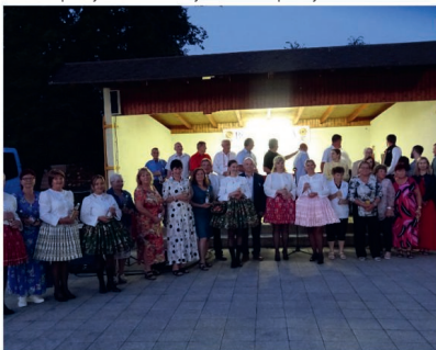
Setkání stárků 2024