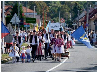
Průvod na Slováckých slavnostech v Uherském Hradišti

Ale nechejme čísel a stavění. V létě jsme se i bavili. Fotbalisté si pro Vás připravili po šesti letech turnaj starých gard, který opět vyhráli. Gratulujeme. Po turnaji pak následovala největší zábava široko daleko - Reflexy originál. Děkujeme za organizaci. V srpnu jsme se pak dočkali pátého ročníku Traktoriády. Po uzávěrcé novin jsme vyrazili do průvodu na Slováckých slavnostech vína. Všem z průvodu, ale i všem ze stánku moc děkujeme za reprezentaci obce. V pondělí 28.10. v den výročí vzniku Československé republiky projde obcí lampionový průvod a pak už se budeme připravovat na Martinské hody. Letos opět se stárky. V