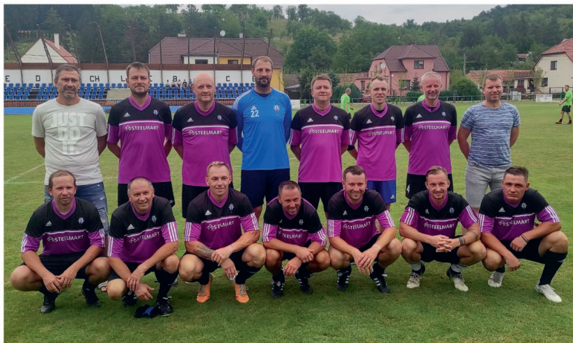
Hráči Staré gardy Nedachlebice - vítězové turnaje 2024