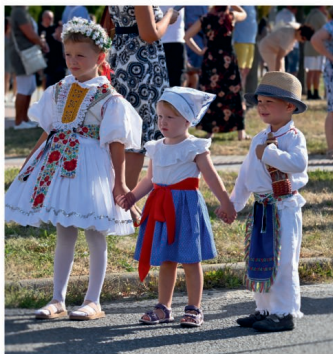
Ti nejlepší z průvodu

Byl jsem osloven, proč nenecháme odpadovou vyhlášku tak, jak je, a proč ji pořád měníme. První změny nastaly s novým odpadovým zákonem a druhé změny si vyžádaly zvýšené náklady na odvoz. Jeden příklad za všechny: Na obci umožňujeme občanům odevzdávat BIO odpad jak do 120l nádob, tak do kontejnerů, přesto se najdou takoví, kteří „nejsou líní“ a například špatné trnky odnesou až do velkých 1000litrových popelnic ke hřbitovu. Tyto nádoby jsou