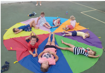
Děti z mateřské školky při soutěžích na hřišti