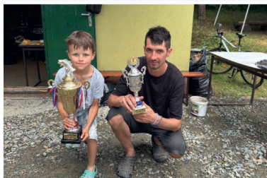
Vítěz dětských závodů