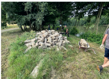
Kamení z cesty na Podbůdii znovu posloužilo - zpevnění břehů