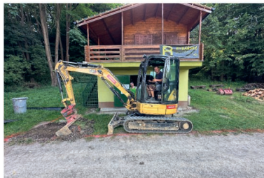
Úprava plochy před rybářskou baštou