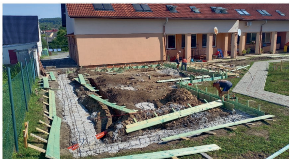
Základové pasy pro Dětskou skupinu Nedachlebice - v areálu mateřské školky roste další třída pro děti