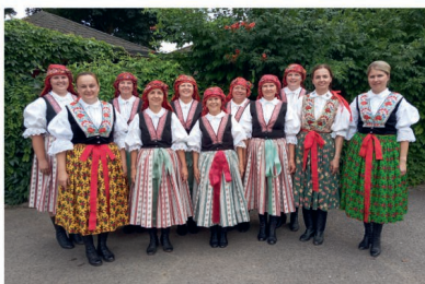
Letní zpívání v Ostrožské Nové Lhotě

Někteří z Vás si také mohli všimnout, že část členek sboru má nové kroje. Protože nám v posledních letech zpěvaček přibýlo, bylo zapotřebí nechat ušít další kroje. Tímto chceme poděkovat obci Nedachlebice za finanční příspěvek v hodnotě deset tisíc korun, za který se kroje ušily.