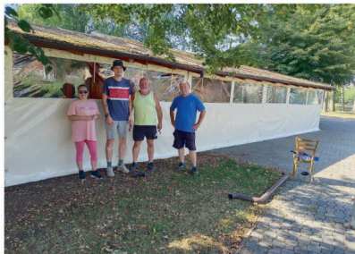
Připravujeme se na zimní jarmark, nové plachty kolem stánku