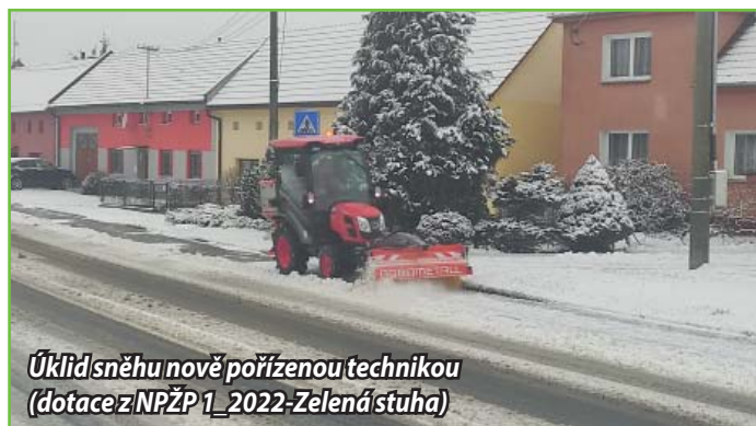
Úklid sněhu nově pořízenou technikou (dotace z NPŽP 1_2022-Zelená stuha)