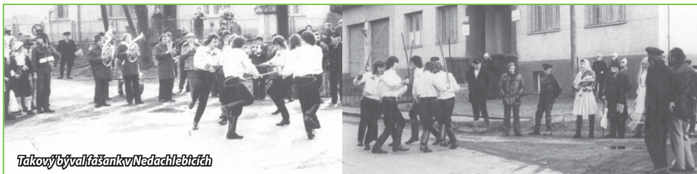
Takový býval fašank v Nedachlebicích