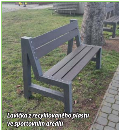
Lavička z recyklovaného plastu ve sportovním areálu