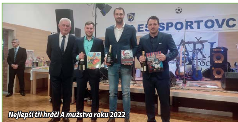
Nejlepší tři hráči A mužstva roku 2022