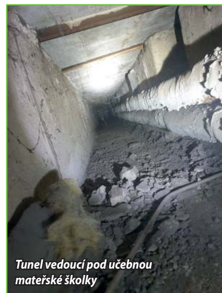
Tunel vedoucí pod učebnou mateřské školky