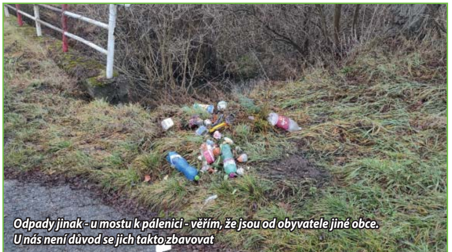
Odpady jinak - u mostu k pálení - věřím, že jsou od obyvatele jiné obce. U nás není důvod se jich takto zbavovat