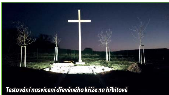
Testování nasvícení dřevěného kříže na hřbitově